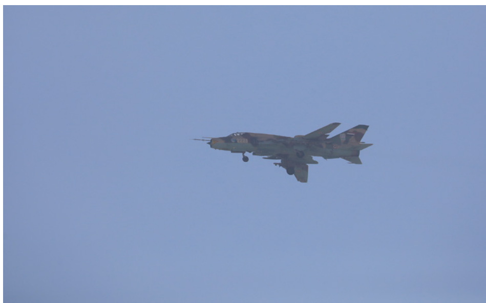
2024年にサナア上空を飛行したフーシー派のSu-22

航空軍は早期に有志連合軍の集中的な攻撃を受け、そのアセットの大半を破壊されたため、内戦初期における活動実態はほとんどない。しかし、フーシー派は破壊された機体の修復を密かに進めていたとみられ、2023年9月21日の軍事パレードにてMi-17輸送ヘリコプターやF-5戦闘機がサナア上空を飛行した。また、2節2項で述べた2018年の西海岸地域での戦いにおいて、同派は国民抵抗軍等に包囲されたホデイダ県ドゥライヒミー市への補給作戦に