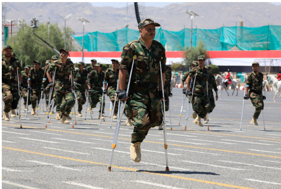
フーシー派の軍事パレードに参加する傷痍軍人

軍については、国防大臣の下に参謀総長と副参謀総長が設置され、参謀総長は「局 (Hay'a)」と局の下に置かれる「部 (Dā'ira)」、陸海空軍、および国境警備隊等の部隊やその他機関を統括する。2025年にイスラエル軍の斬首作戦によってガンマーリー参謀総長が死亡した後、同年10月からマダーニーが参謀総長を務める(表2参照)。両者はフーシー派の古参幹部であり、特にマダーニーはフサイン・フーシーの娘と結婚していることで知られる。副参謀総長は、軍出身でホデイダ県配置転換国家代表団代表を兼任するアリー・ムーシュキー (Alī al-Mūshkī,