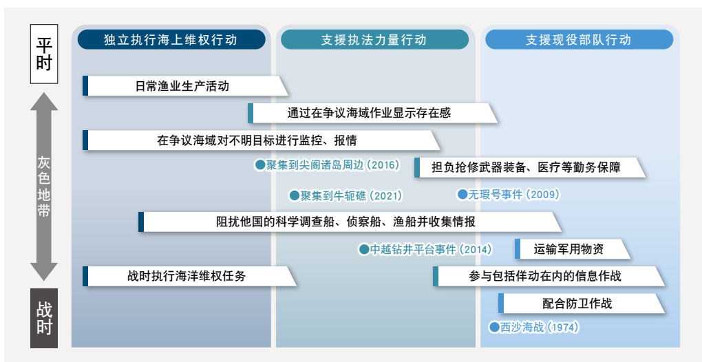
图3-2：海上民兵组织的任务

海上民兵可能承担下列具体任务：首先是发挥其人数和装备优势，主要承担各行为主体难以进行合作和活动的海上维权行动；其次是可能承担军队与行政组织、民间的中介职责。此外，海上民兵部队与中国海警局和人民解放军相比，不仅能够在浅海域履行职责、运用更加小型机动的船舶，还可以通过大量渔船实施更广泛的预警活动。中国政府有可能认为，通过动员海上民兵，可以实现控制危机升级、牵制敌对国家、避免军事冲突、扩大实际控制范围。