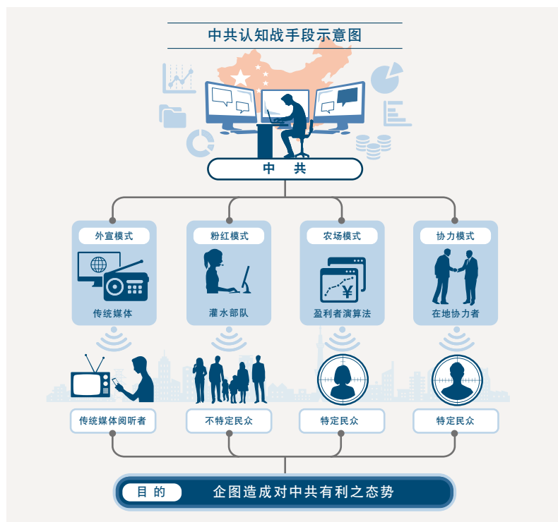
图2-6 台湾国防报告中记载的“认知战”手段示意图

(出处) 根据中华民国 110 年国防报告书编纂委员会编《中华民国 110 年国防报告书》国防部，2021 年，第 44 页制作。