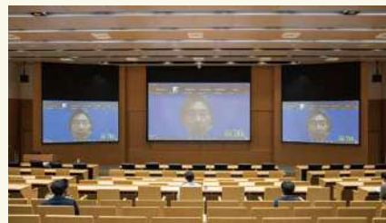
ASEANワークショップ 2023年2月 ASEAN Workshop (February 2023)

NIDS began this workshop in 2019 as a successor to the International Workshop on Asia Pacific Security, which had been held since 2010. Participants engage in dialogs and discussions with security researchers from countries in the region in a workshop format.