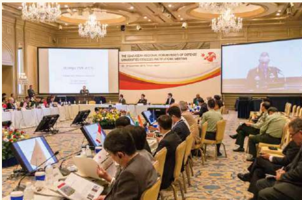
ARF国防大学校長等会議 ARF Heads of Defense Universities/Colleges/ Institutions Meeting

A representative from NIDS served as vice chair at the 21st meeting, held in Manila in 2017, and as chair at the 5th meeting in 2001 and the 22nd meeting in 2018, both held in Tokyo.