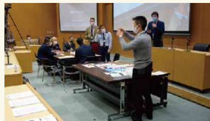
コネクションズ・ジャパン 2022年11月 Connections Japan (November 2022)

As a means of strengthening MOD's intellectual foundation, NIDS has been holding the Connections Japan conference since 2022 to share knowledge with policy simulation experts from around the world and to learn and further develop the latest policy simulation methods, which can contribute to the improvement of both policy support and educational support.