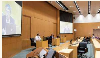
戦争史研究国際フォーラム 2022年9月 International Forum on War History (September 2022)

NIDS began this forum in 2002 for the purpose of reviewing war history from multiple perspectives. At the forum, which is open to the public, foreign researchers give presentations on military history with the aim of deepening understanding and trust among participating countries.