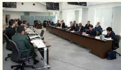
交流風景 Interacting with overseas researchers