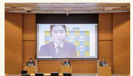
安全保障国際シンポジウム 2022年12月 International Symposium on Security Affairs (December 2022)

This symposium began in 1985 as the International Roundtable Discussion and was renamed as its current title in 1999. Every year, NIDS brings together renowned intellectuals from home and abroad, and holds this event as a public symposium open to a wide variety of audience members, such as government and military personnel, researchers and experts, journalists and member of the general public who are interested in the themes discussed.