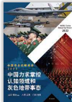
中国安全保障レポート 日本語版・英語版・中国語版(2023) NIDS China Security Report , Japanese, English, and Chinese versions (2023)