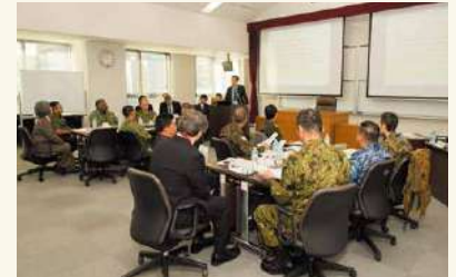
政策支援におけるシミュレーションの活用 Utilization of simulations in policy support