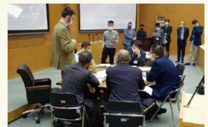
国際会議(コネクションズ)におけるシミュレーション展示 Simulation presentation at an international conference (Connections)