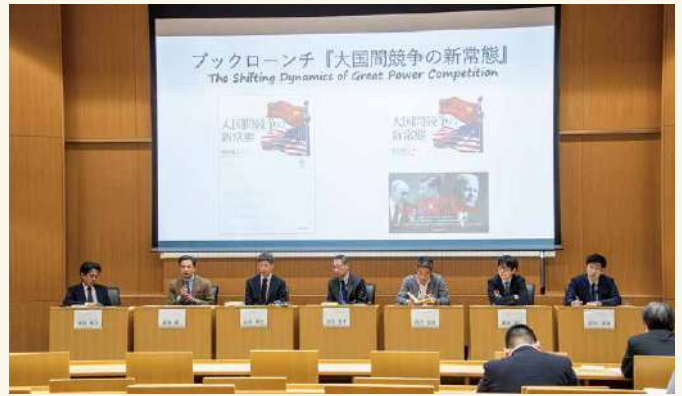
NIDSパースペクティブのブックローンチ風景 2023年4月 Book Launch Scene of NIDS Perspective (April 2023)