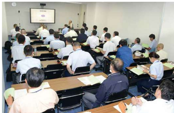
防衛研究所内におけるセミナー風景 A seminar at NIDS

In cooperation with the MOD internal bureau and the SDF, NIDS conducts research on defense strategies, security legislation, crisis management, desirable forms of the Japan-U.S. alliance and national defense organizations, the trends in defense exchanges and cooperation on equipment with other countries.