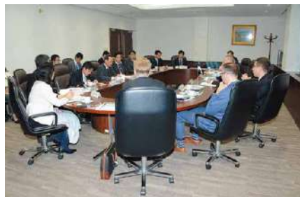
国外の研究機関との意見交換風景 Dialogue with overseas research institutions

At NIDS, civil service researchers with academic knowledge and SDF officer-researchers work together to conduct research on various issues concerning Japan's security, to investigate, collect, and study military history documents, as well as to continuously and systematically create records of oral history. In addition, NIDS actively conducts intellectual exchanges with government agencies, domestic and overseas universities, think tanks, and so forth.