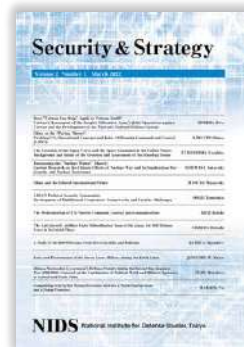
安全保障戦略研究 日本語版・英語版(2022) Security & Strategy , Japanese and English versions(2022)