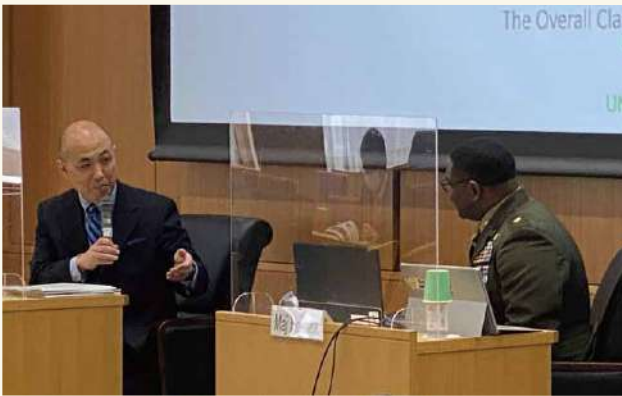
研究会風景 2023年2月 Research Conference (February 2023)

NIDS' research findings are published in Security & Strategy as well as in NIDS Perspective (Japanese and English versions), which analyzes global and regional security-related issues, and in China Security Report (Japanese, English, and Chinese versions), which offers multi-faceted analyses of China's strategic and military trends. NIDS' findings also draw the attention of domestic and overseas media outlets, government personnel, and experts. In addition, NIDS uses the research findings it has accumulated over the years and its knowledge of security and regional relations to organize frequent workshops and symposia, inviting domestic and overseas experts in diverse range of fields. NIDS also welcomes foreign government personnel, delegates, and noted security experts to exchange ideas with research fellows at NIDS.