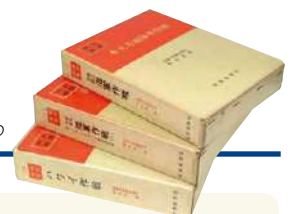
戦史叢書 Senshi Soshō

Senshi Soshō , a compilation of the military history of World War II, encompasses a total of 102 volumes published between 1966 and 1980 by the Office of War Study, the predecessor of the Center for Military History, to contribute to education and research at the SDF, and this collection is available for viewing on the NIDS website.